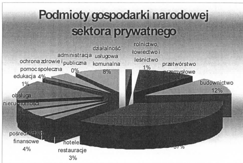
Wykres 1. Podmioty gospodarki narodowej sektora prywatnego, zarejestrowanych w rejestrze REGON wg sekcji PKD (stan na 31 grudnia 2007 roku).

(87) Strukturę podmiotów gospodarki narodowej sektora prywatnego, zarejestrowanych w rejestrze REGON wg sekcji PKD prezentuje poniższy wykres.