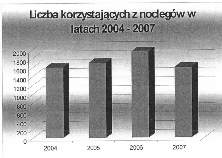
Wykres 2. Liczba osób korzystających z noclegów w Szubinie w latach 2004 - 2007

(98) Dane dotyczące liczby turystów korzystających z noclegów na terenie Miasta w latach 2004 – 2007 prezentuje poniższy wykres.