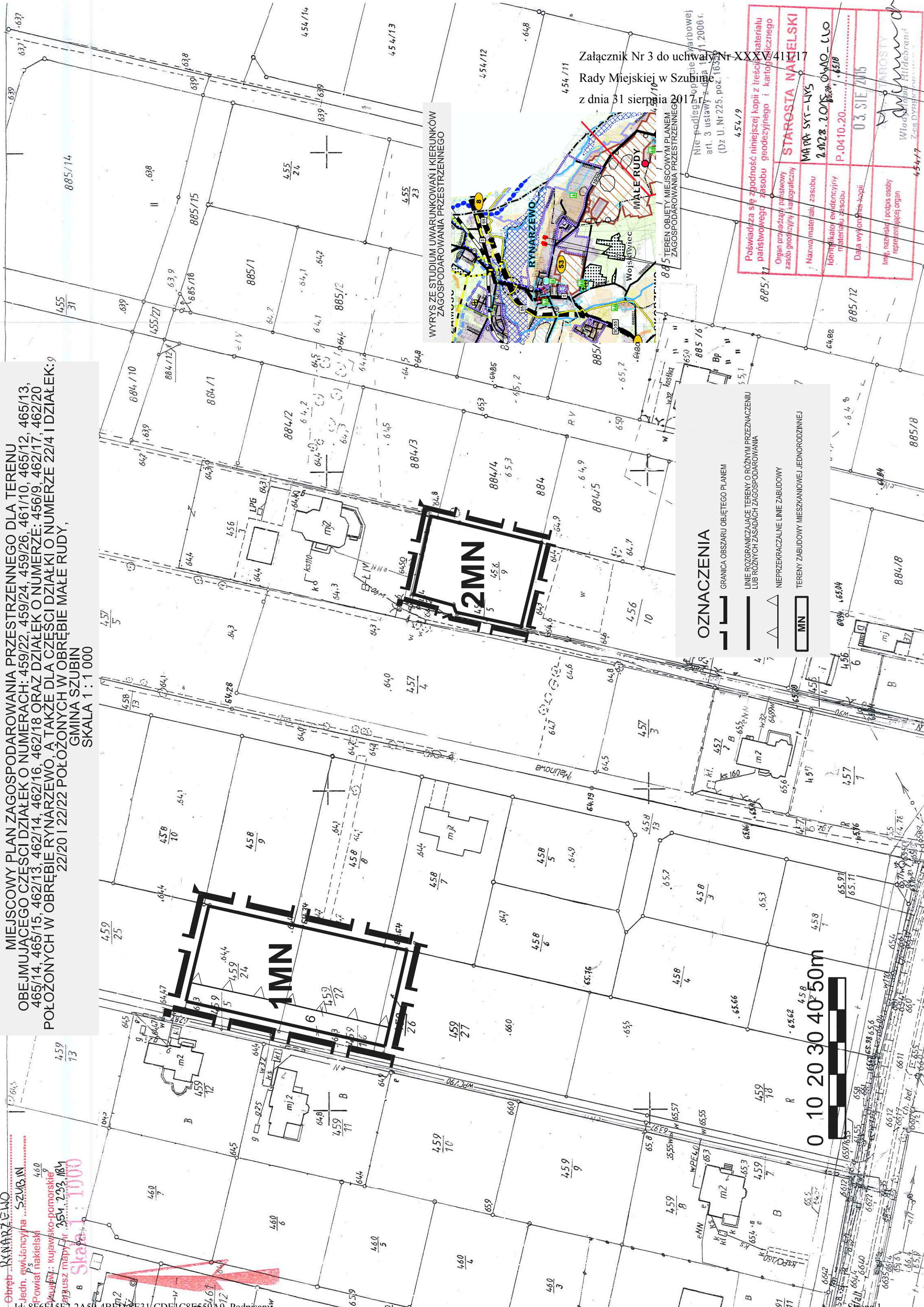
WYRYS ZE STUDIUM UWARUNKOWAŃ I KIERUNKÓW ZAGOSPODAROWANIA PRZESTRZENNEGO

MIEJSCOWY PLAN ZAGOSPODAROWANIA PRZESTRZENNEGO DLA TERENU OBEJMUJĄCEGO CZĘŚCI DZIAŁEK O NUMERACH: 459/22, 459/24, 459/26, 461/10, 465/12, 465/13, 465/14, 465/15, 462/13, 462/14, 462/16, 462/18 ORAZ DZIAŁEK O NUMERZE: 456/9, 462/17, 462/20 POŁOŻONYCH W OBRĘBIE RYNARZEWO, A TAKŻE DLA CZĘŚCI DZIAŁKI O NUMERZE 22/4 I DZIAŁEK: 9 22/20 I 22/22 POŁOŻONYCH W OBRĘBIE MAŁE RUDY, GINIA SZUBIN SKALA 1 : 1 000